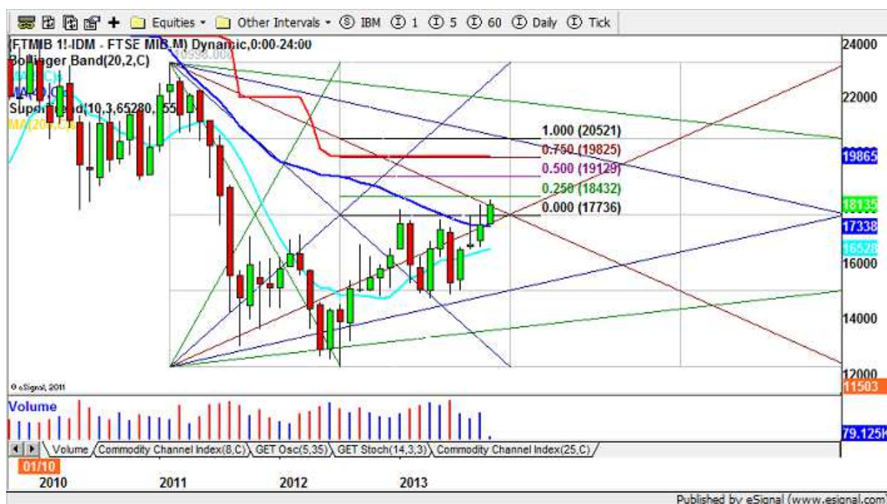
Figura 1: FIB grafico settimanale

Quello sopra riportato e' il grafico del future sull'indice italiano, il FTSE MIB. I prezzi del future sono inserito in quello che viene chiamato Gann Box, che ora vi spiego.