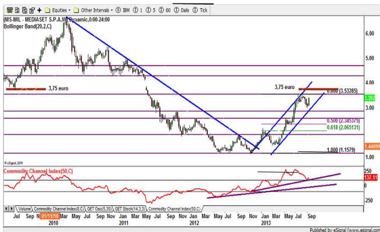
Figura 1: Mediaset (blomberg ticker: MS IM) grafico settimanale

Il titolo Mediaset ha avuto un'ottima performance dall'inizio dell'anno arrivando a raggiungere la ragguardevole performance di più del 100% nello spazio di soli nove mesi.